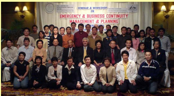
การสัมมนาและอบรมเชิงปฏิบัติการเรื่อง “Emergency & Business Continuity Management & Planning”